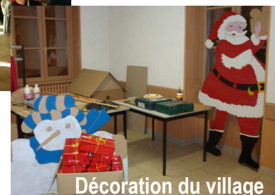
Décoration du village