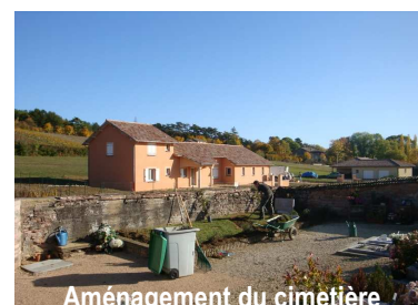
Aménagement du cimetière