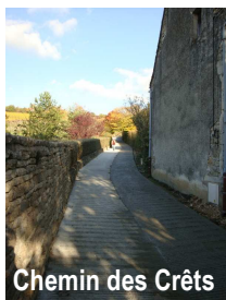
Chemin des Crêts

Par ailleurs, dès que la commune a été propriétaire du chemin reliant la rue Grange Duval à la RD56 (route départementale n°56), le revêtement en a été refait et ce, à une fin beaucoup plus durable.