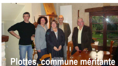
Plottes, commune méritante