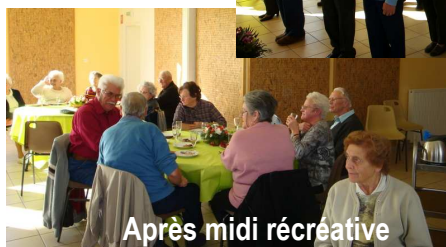
Après midi récréative